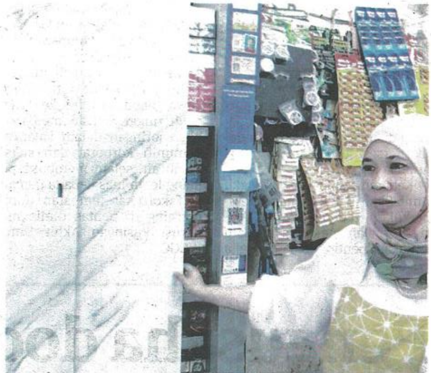
PEKERJA sebuah kedai runcit di Kampung Paya, Kluang, Johor menunjukkan rak jualan rokok secara bertutup.